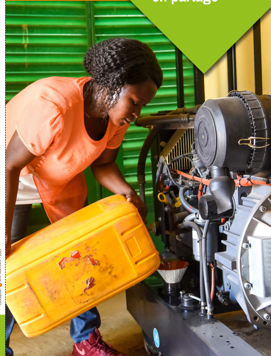
Conception Terre Nourricière - 2023